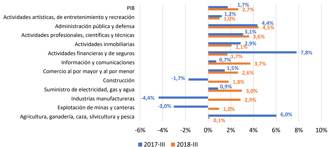
Gráfico 2. PIB oferta anual por sectores (Var. % anual)